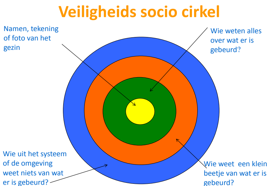
Figuur 2. Veiligheids Socio cirkel